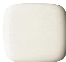
#SC1 パステルアイボリー※