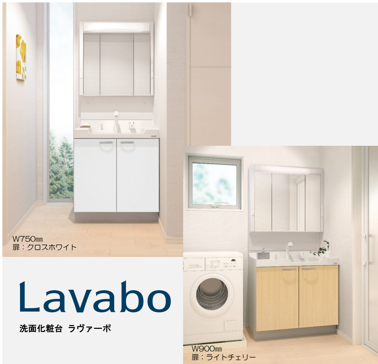
W750mm 扉：クロスホワイト